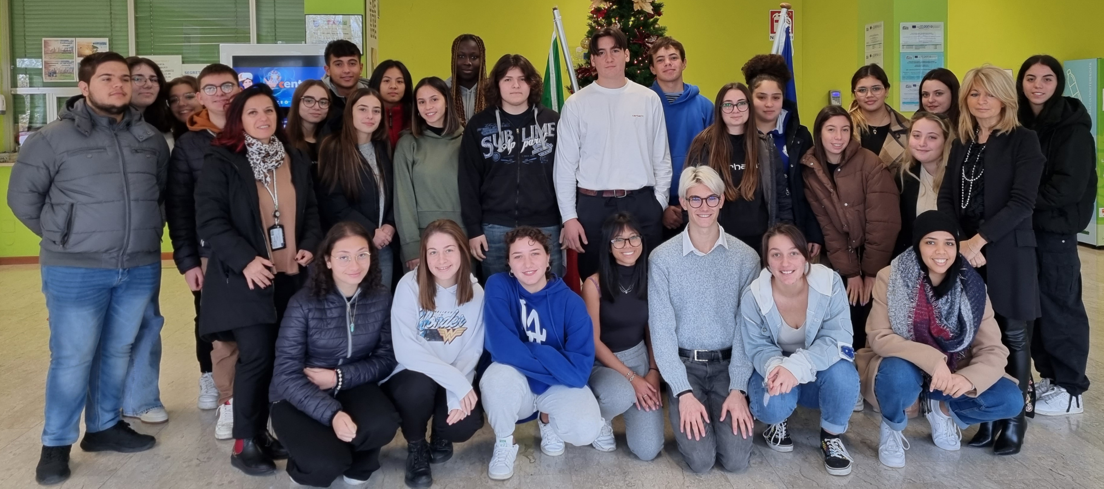
4 A e 4B Turismo