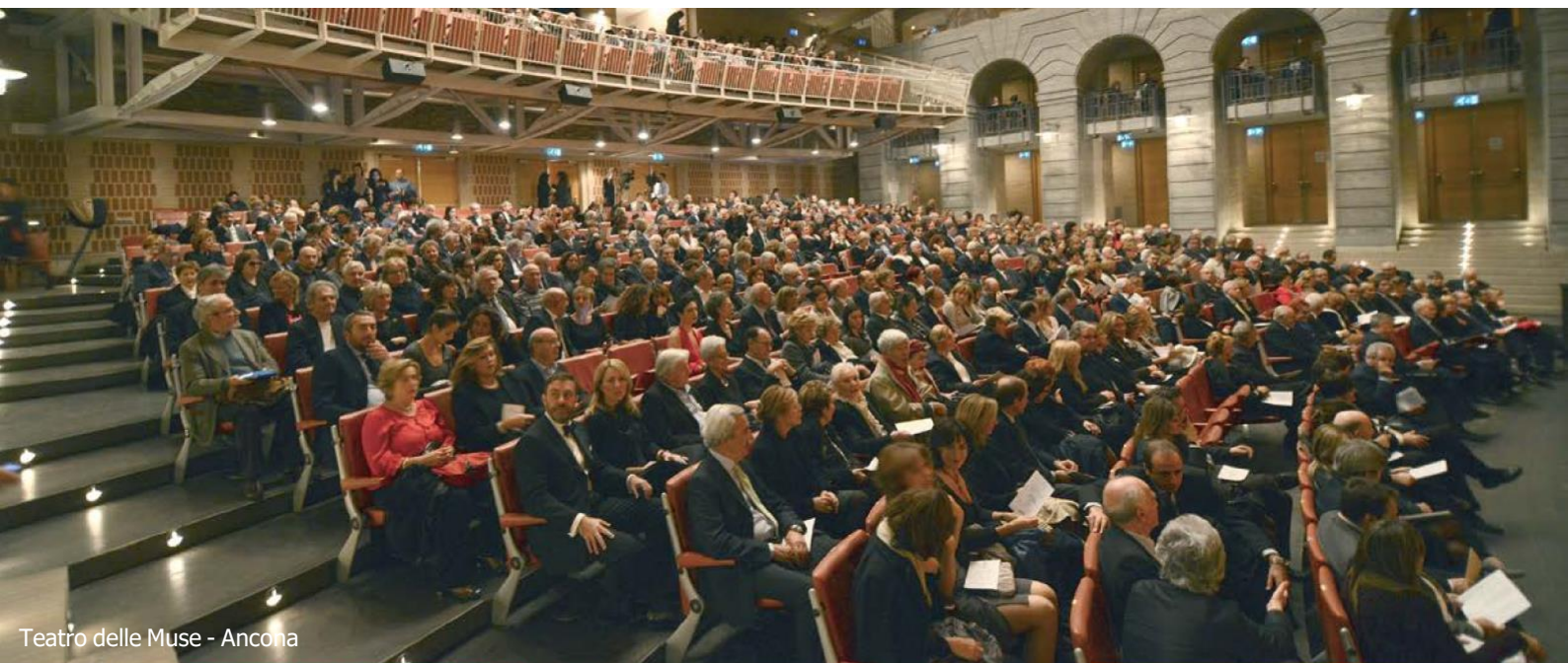
Teatro delle Muse - Ancona