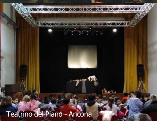
Teatrino del Piano - Ancona