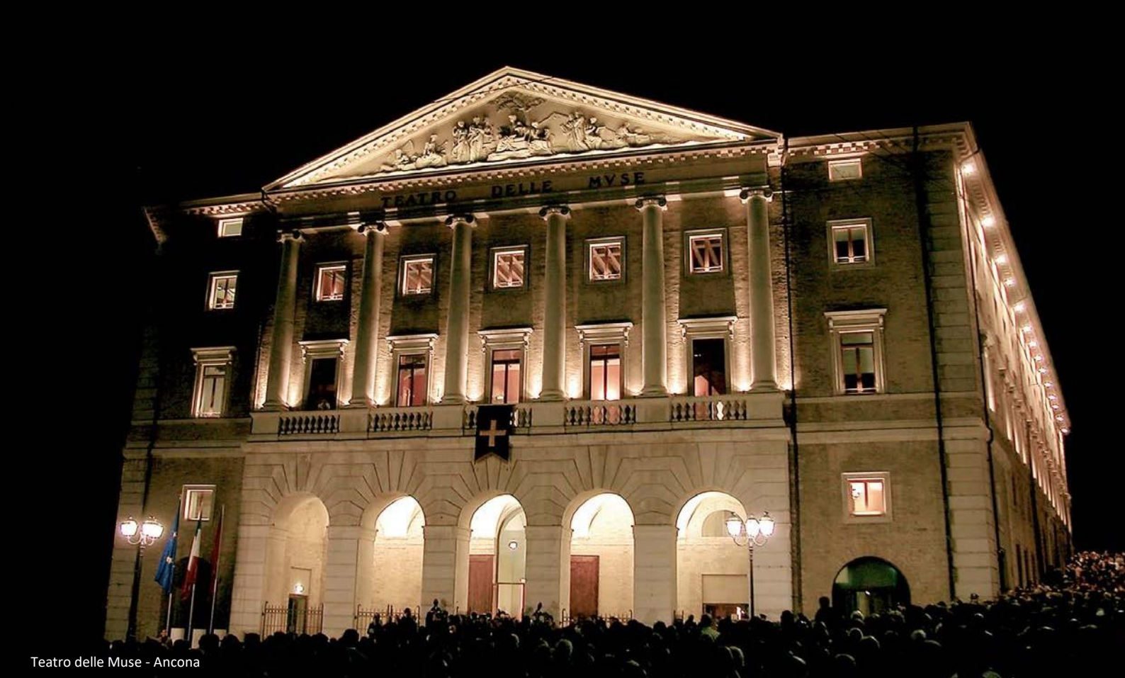
Teatro delle Muse - Ancona