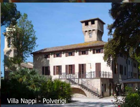
Villa Nappi - Polverigi