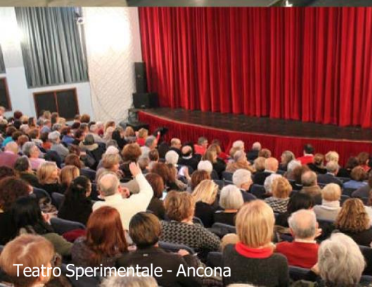
Teatro Sperimentale - Ancona