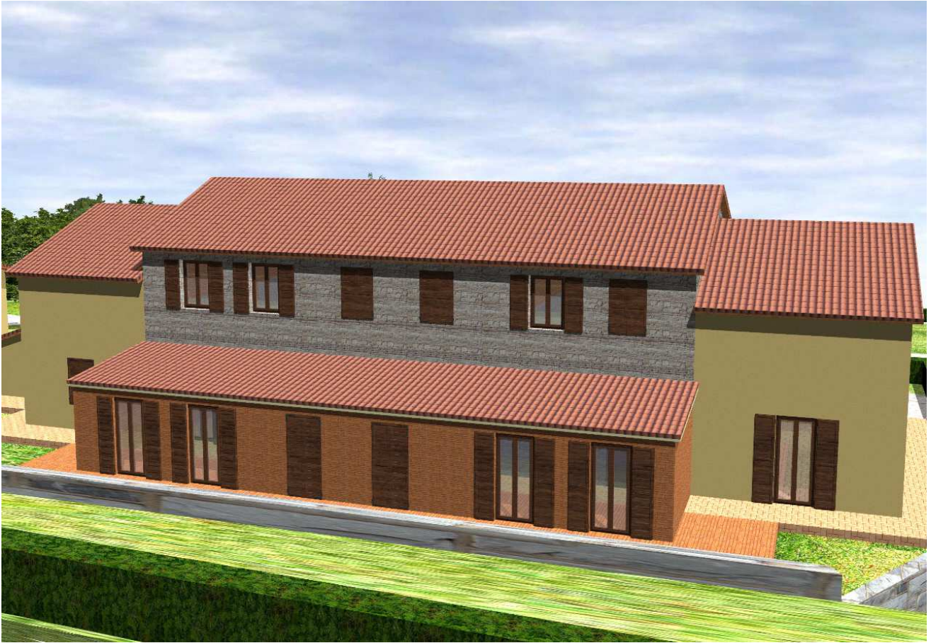
Vista da nord edificio A