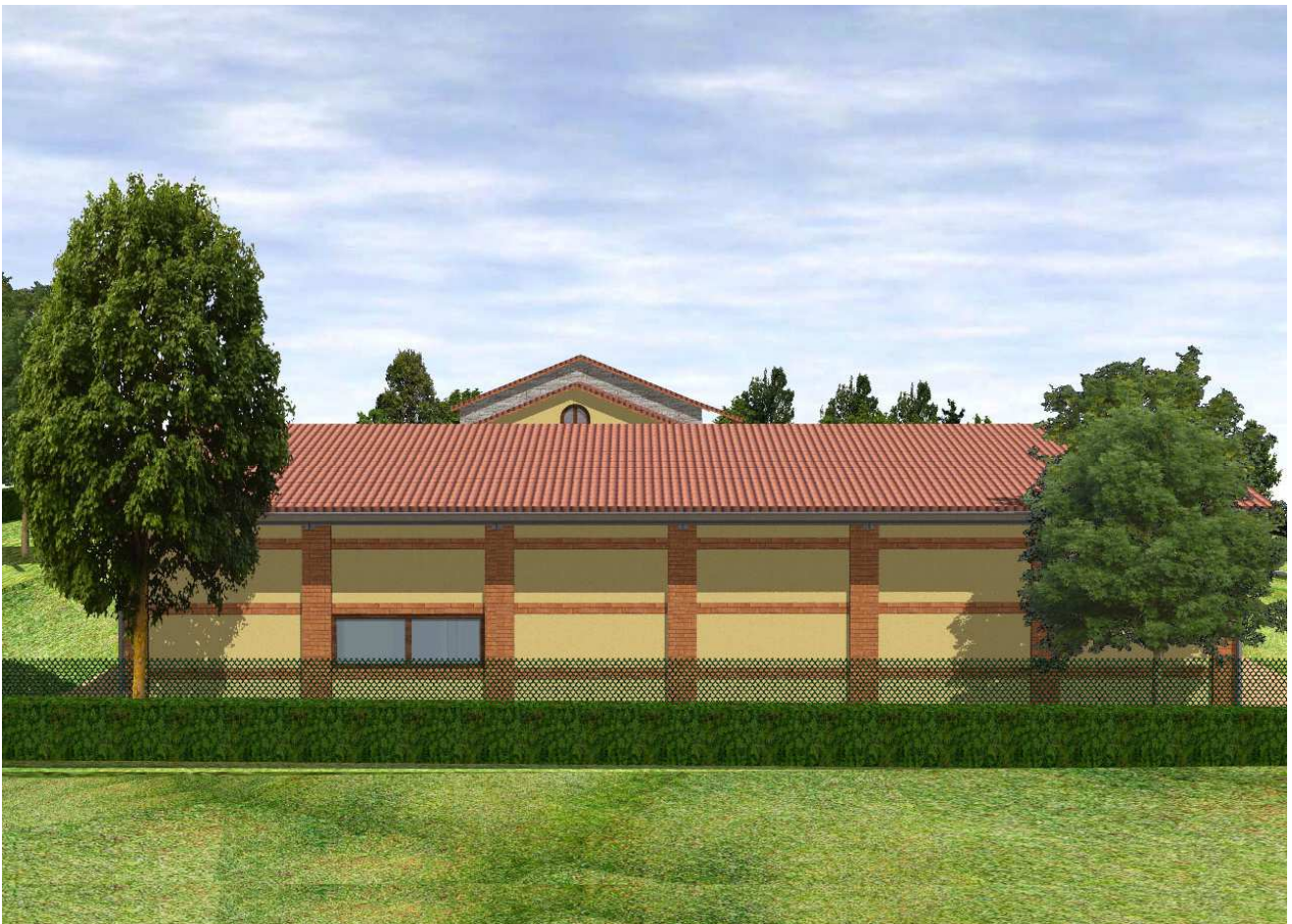
Vista da nord-ovest edificio C (ex fienile)