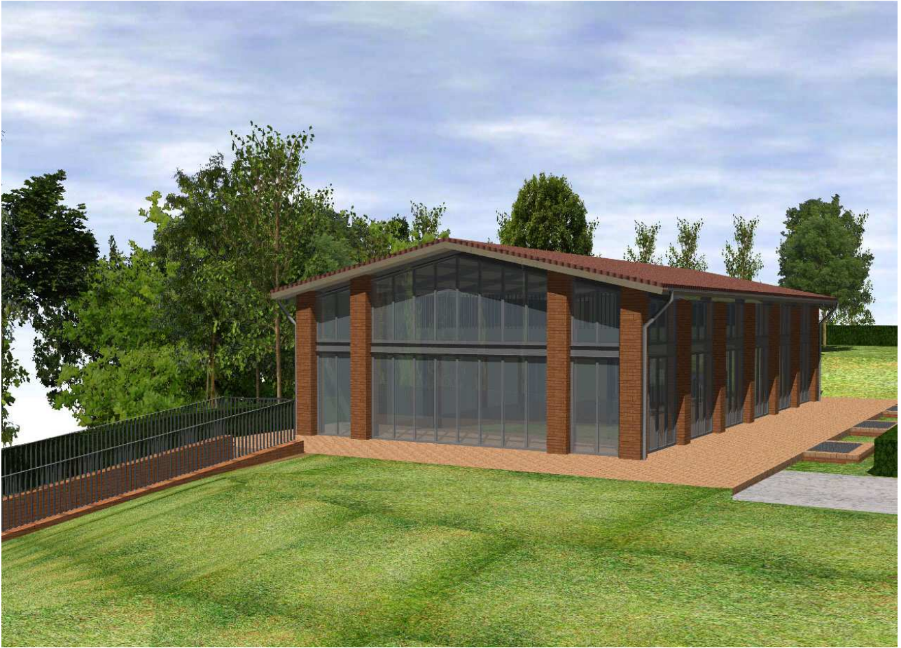
Vista da sud edificio C (ex fienile)