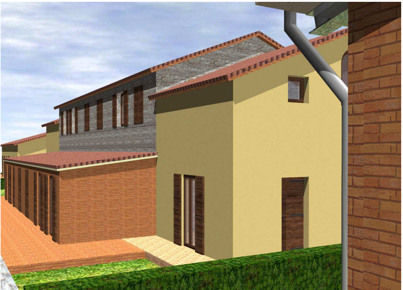
Vista da nord-ovest edificio A