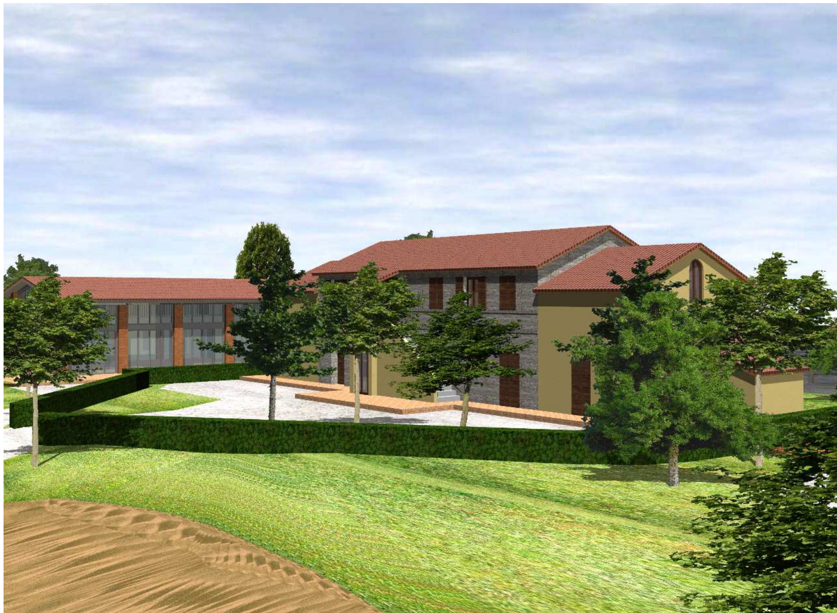
Vista da sud-est edificio A ed edificio C (ex fienile)