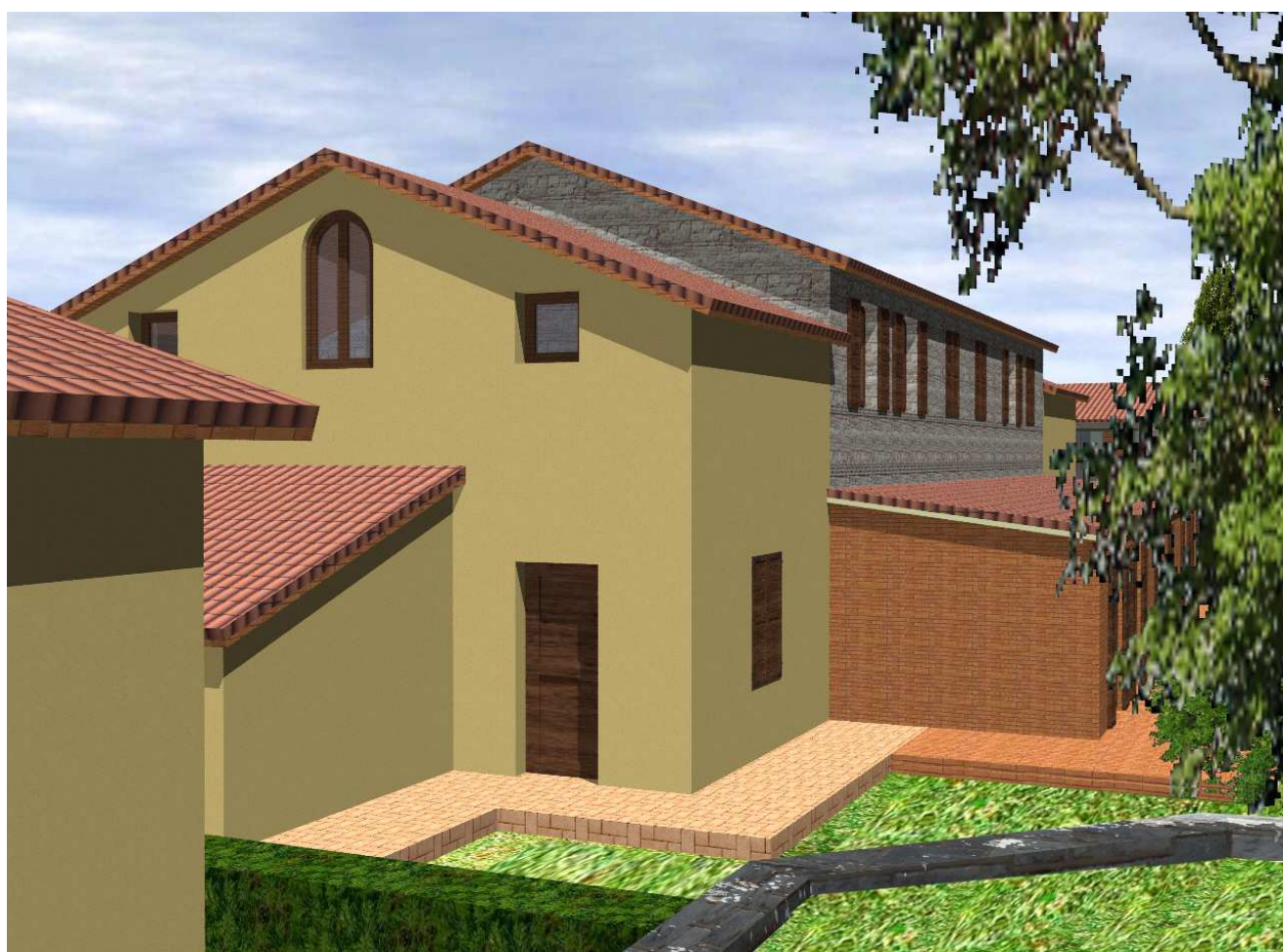
Vista da nord-est edificio A