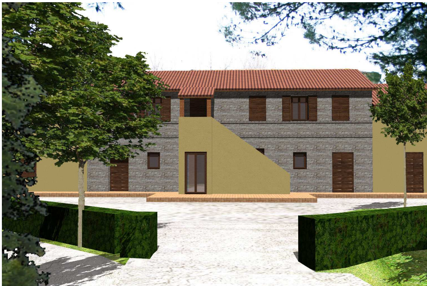
Vista da sud edificio A