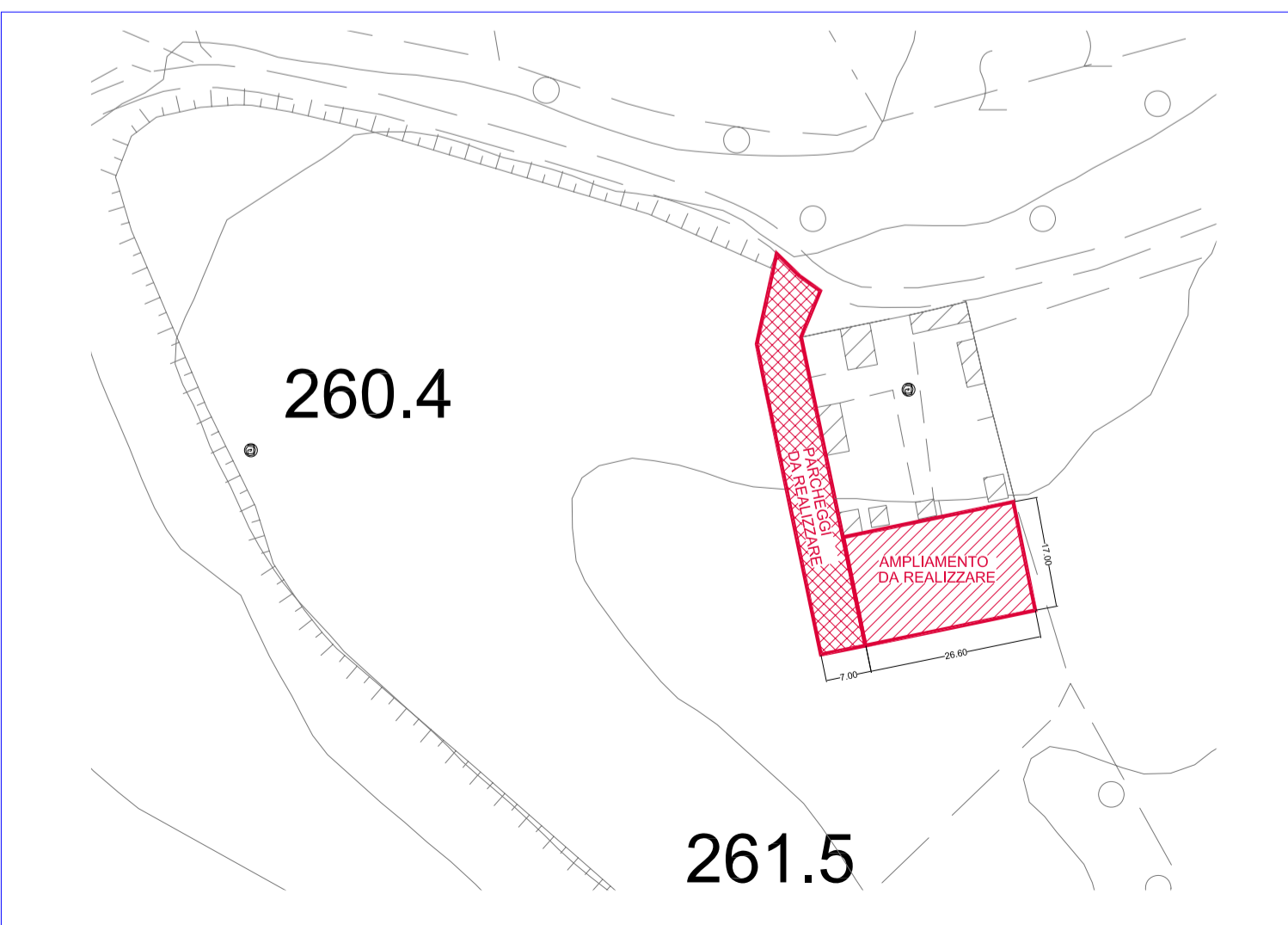
Schematizzazione ampliamento previsto dal P.R.C. scala 1:1000