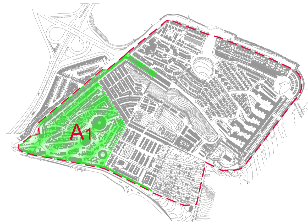
inquadramento generale zona omogenea A (scala 1:5000)