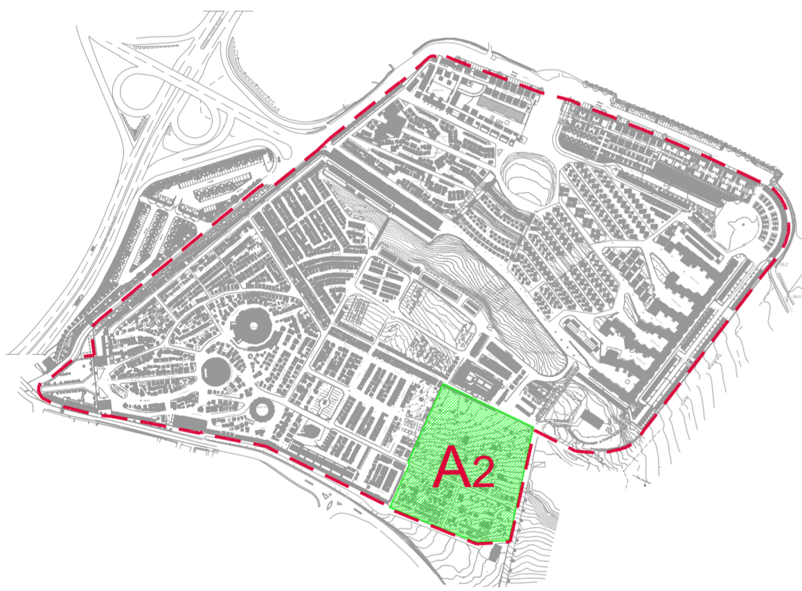
inquadramento generale zona omogenea A (scala 1:5000)