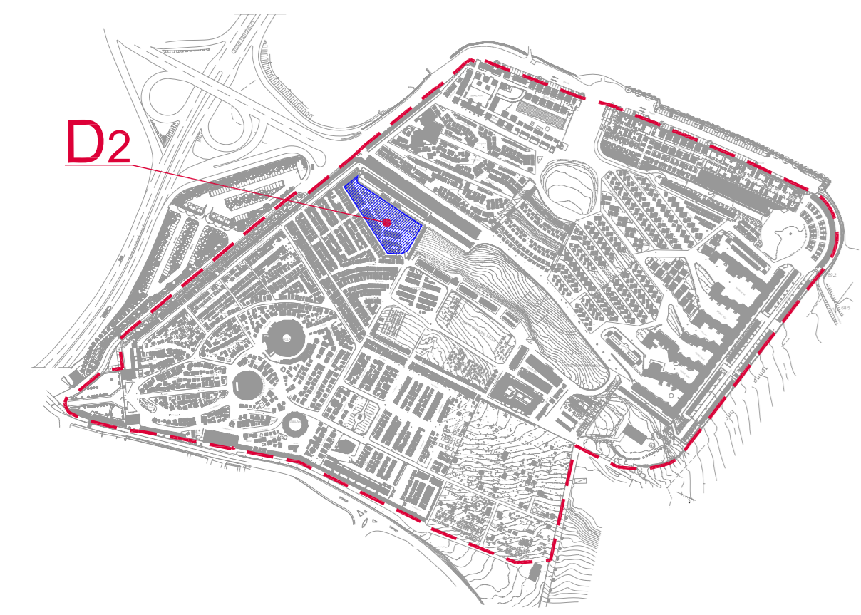
inquadramento generale zona omogenea D2 (scala 1:5000)