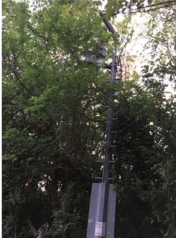
FOTO 1: PALO PORTA ANTENNE E PARABOLE STATO POST OPERAM (PARABOLA DI PROGETTO NON VISIBILE)

FOTO 1: PALO PORTA ANTENNE E PARABOLE STATO ANTE OPERAM