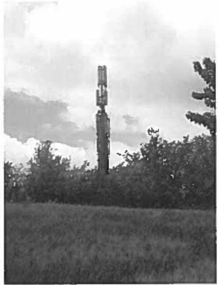
Post Operam Foto 1 - da Nord Est