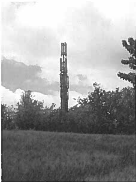
Ante Operam Foto 2 - da Nord Est