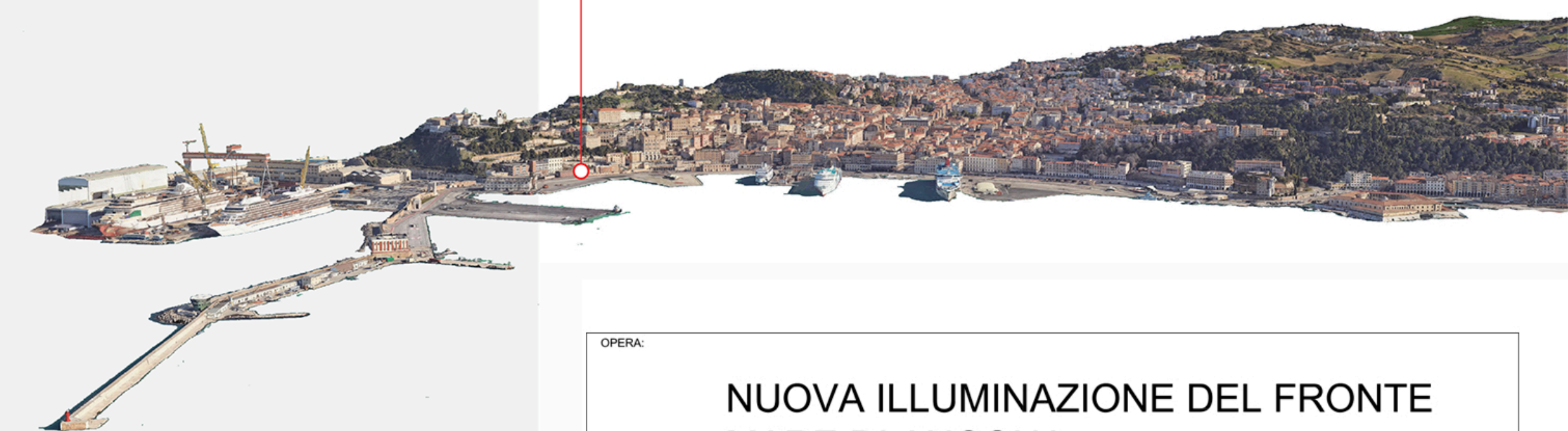
CARATTERISTICHE DEI CORPI ILLUMINANTI DI RIFERIMENTO