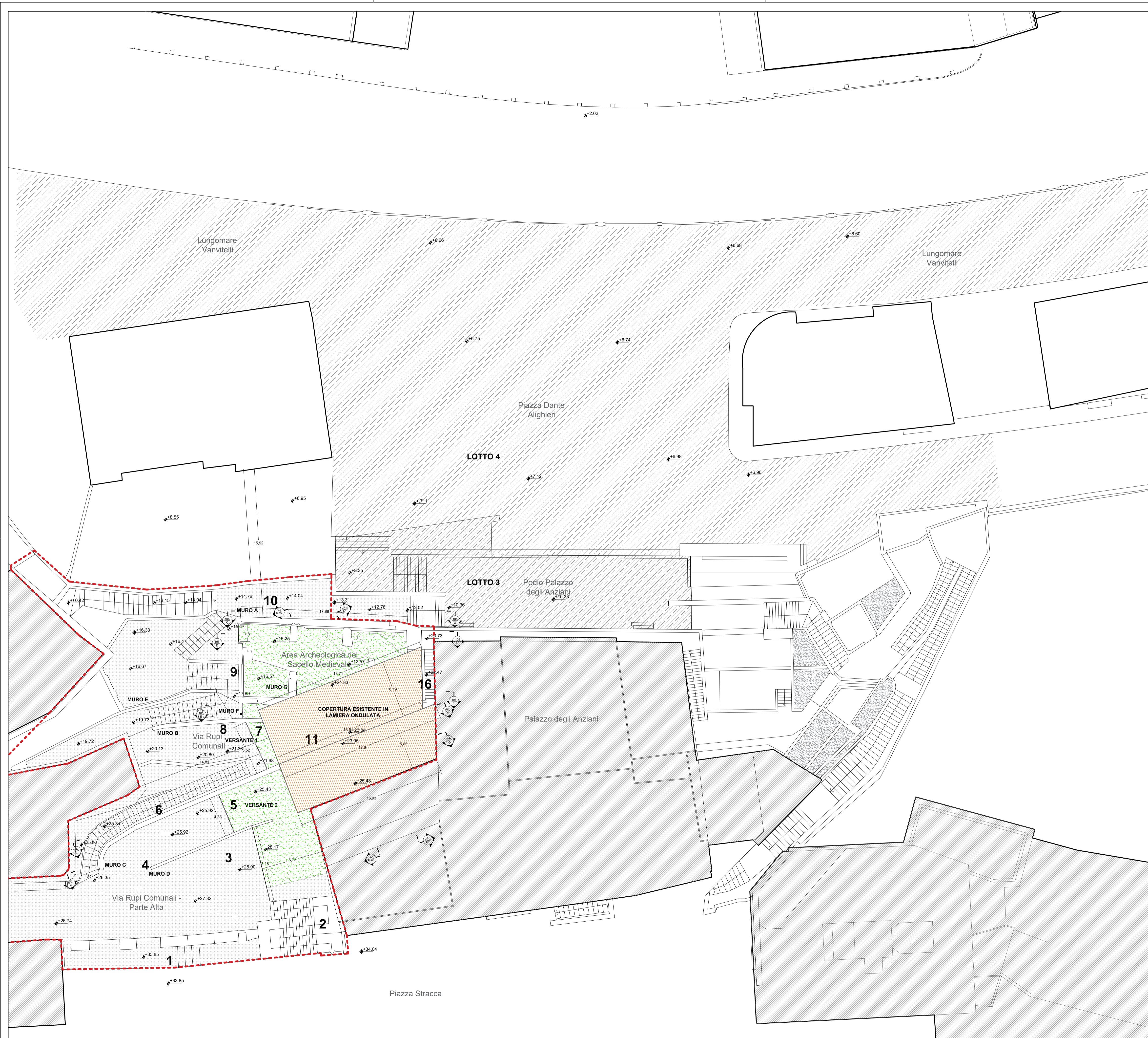
1 Planimetria - Quota +34 1:200