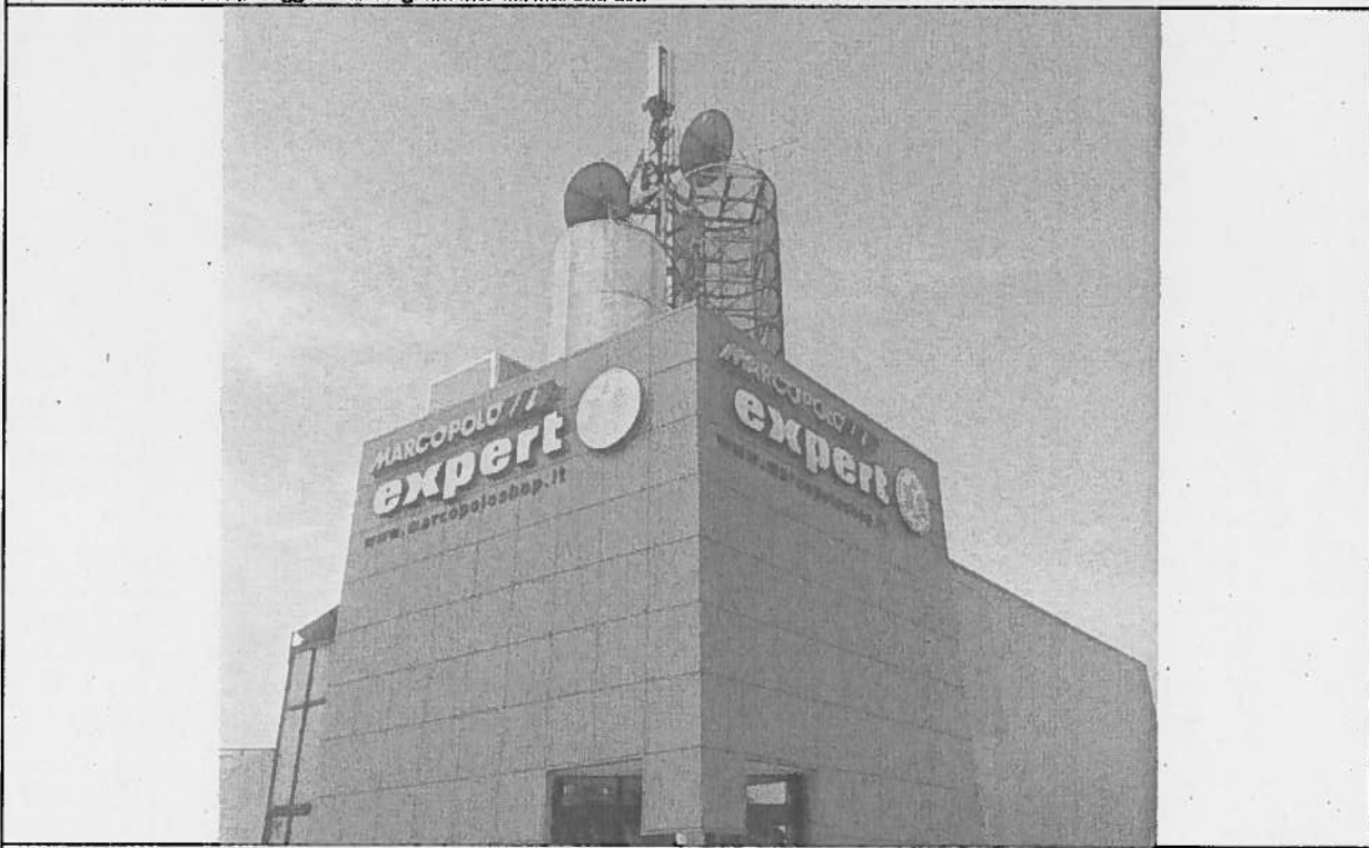
Foto 2: Vista della stazione oggetto di adeguamento dal lato Nord-Est.