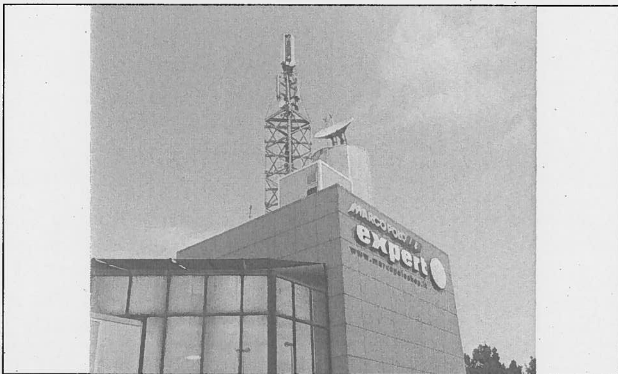
Foto 1: Vista della stazione oggetto di adeguamento dal lato Sud-Est.